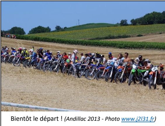
Bientôt le départ ! (Andillac 2013 )

Après les spectacles qui nous ont été offerts par le Toulouse TC pour le Trial Indoor de Toulouse (31) et le prestigieux Master MX Inter de Lacapelle Marival (46) qui aura permis aux meilleurs pilotes mondiaux de préparer leur saison et aux pilotes 125cc du Championnat de Ligue de démarrer le Championnat de Ligue, c'est au tour du Moto-Club Rabastinois d'ouvrir le bal du Championnat de Ligue d'Endurance Tout Terrain à Mezens (81).