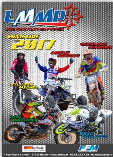
Annuaire LMMP 2017